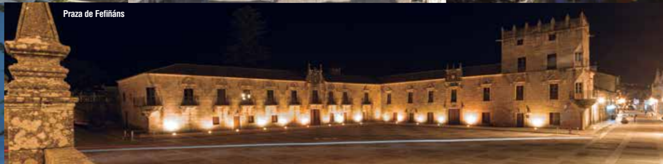
Praza de Fefiñáns