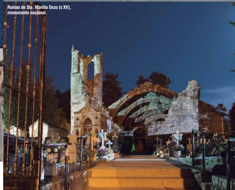
Ruínas de Sta. Mariña Dozo (s XV), monumento nacional