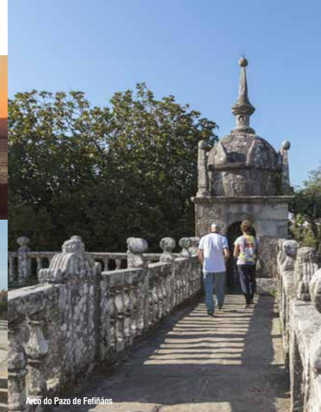
Arco do Pazo de Fefiñáns