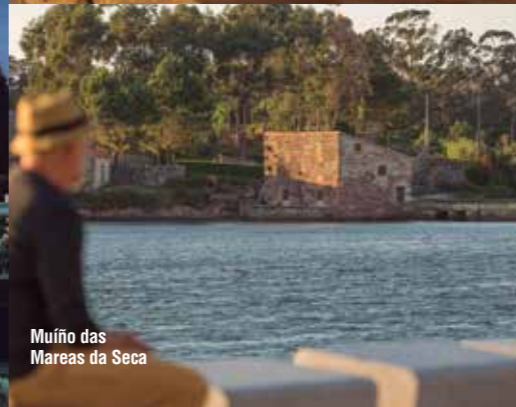
Muño das Mareas da Seca