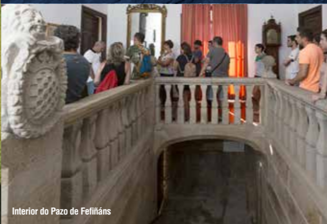
Interior do Pazo de Fefiñáns