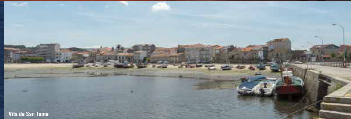
Vila de San Tomé

"CAMBADOS É UN MUSEO DE ARTE AO AIRE LIBRE OU COMO UNHA COMPOSICIÓN DE ORFEBRERÍA EN PEDRA LABRADA, QUE DESCOBRE OS SEUS ENCANTOS A QUEN O VISITA"