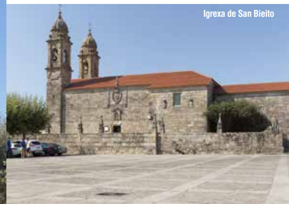
Igrexa de San Bieito